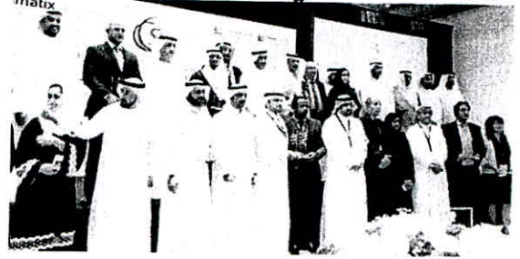
لقطة تذكارية للفائزين